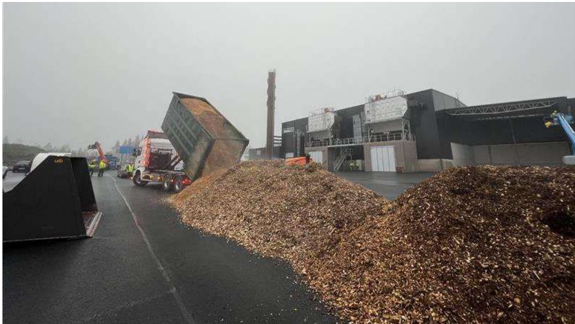
Första lasset med flis till nya värmeverket på Götafors

Bolagets upplåningskostnader har stigit kraftigt under året p.g.a. den ökande räntenivån i samhället samt den nyupplåning som sker för att finansiera de nya anläggningarna som bolaget bygger. Ökande räntekostnader kommer hanteras inom den normala budgetprocessen framåt.